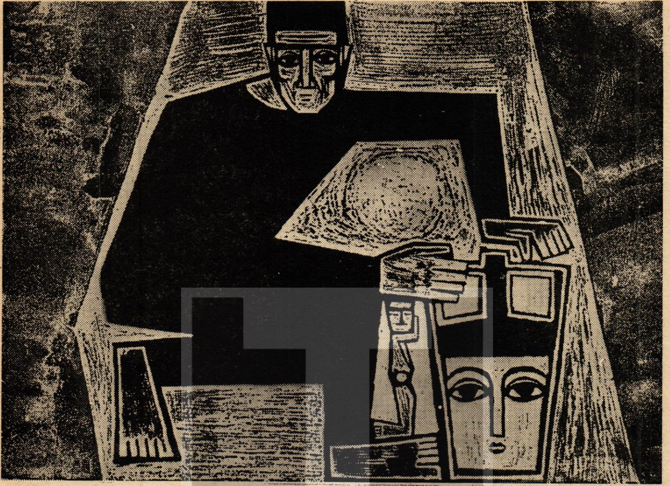
Mustafa Asher'den bir desen