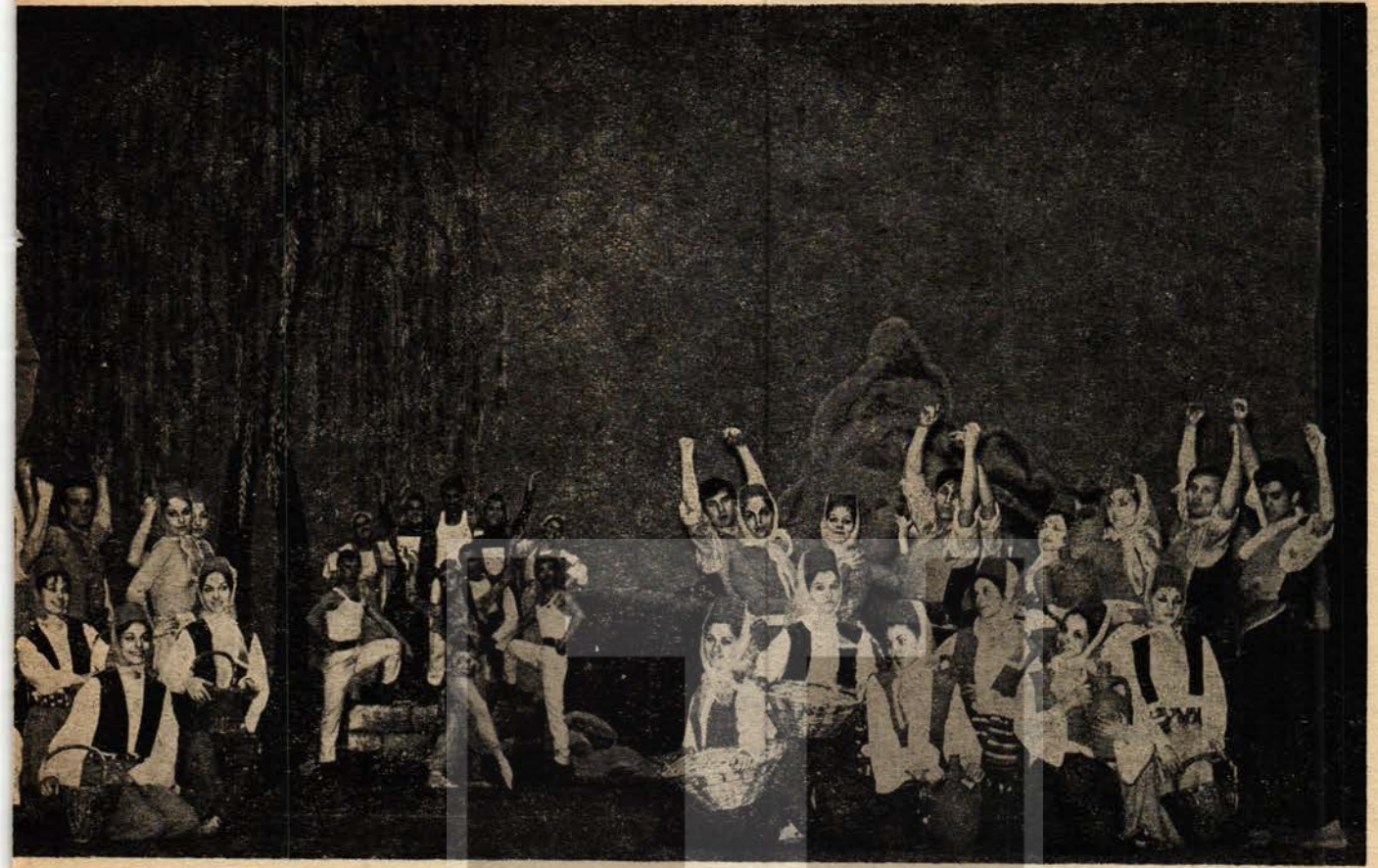
Çeşmebaşı balesinden bir sahne

tertiplenmişti. Orada Ulvi Cemal Erkin'in orkestra için "Koçekçe ve Dans Rapsodisi" ile Adnan Saygun'un "Bir Orman Masalı" Koreografik süitini seyretmiştik. Birincisi tamamen folklor unsurları taşıyordu. Ancak ille de folklor ille de milli dans üzerinde ısrar etmekte mana yok. İngilizlerin bile halen bir milli balesi yoktur. Şimdilik bizdeki klâsik yolda beklediğimizden de daha iyi sonuçlar aldık, klâsik baleyi ilerletmeğe çalışalım. (Sarıraç, The Rake's Progress, Uyuyan Güzel, Giselle balesi unutulacak gibi değil). Yakın gelecekte topluluğun Primabalerina, birinci solistlerini seçmek gerekecek. Yetişen gençleri fazla harcamayalım. Balenin bütün sanatların arasında hepsinden güç, daha çok idealizm, daha çok ruhi içtenlik isteyen bir meslek olduğunu unutmayalım. Kendimize has bir usul bulup, aramızda yetişen koreograflar, besteci ve dekoratörlerle işbirliği yapabilecek duruma geldiğimiz zaman özgü bir Türk balesi doğabilecek ve başarıya ulaşabileceğiz ancak.