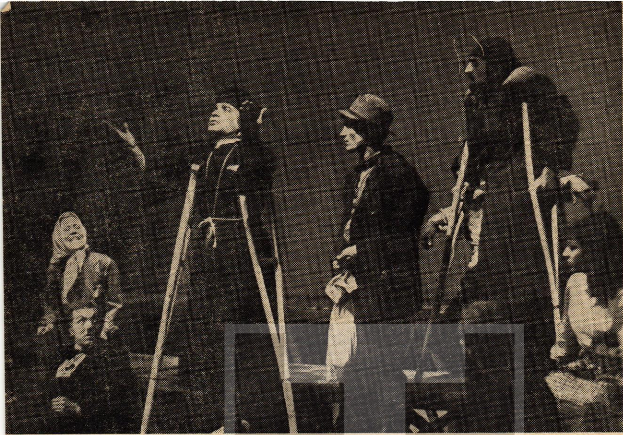
"Ayak Bacak Fabrikası'ndan bir sahne